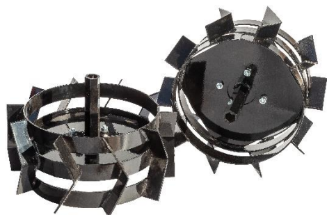
Set roți metalice 350 mm sau 400 mm cu adaptoare de fixare