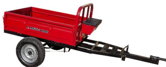
Remorcă 400 kg sau 500 kg